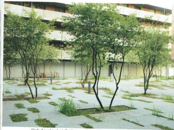
Sidi-Areal in het Zwitserse Winterthur van Kuhn Landschaftsarchitekten