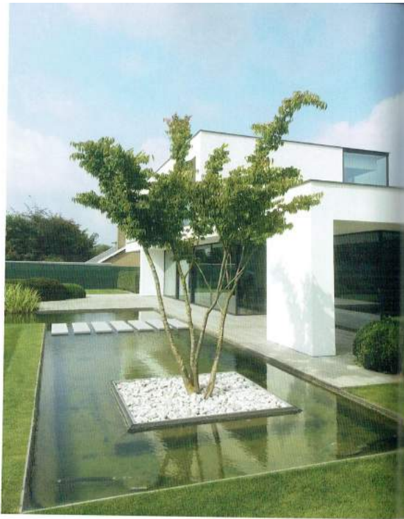
Zelkova serrata bij een privéproject van Van Tieghem

organisch tegengewicht voor strakke, stedelijke architectuur; of voor landschappelijke beplantingen op bijvoorbeeld rotondes of een laanbeplanting met een unieke uitstraling.