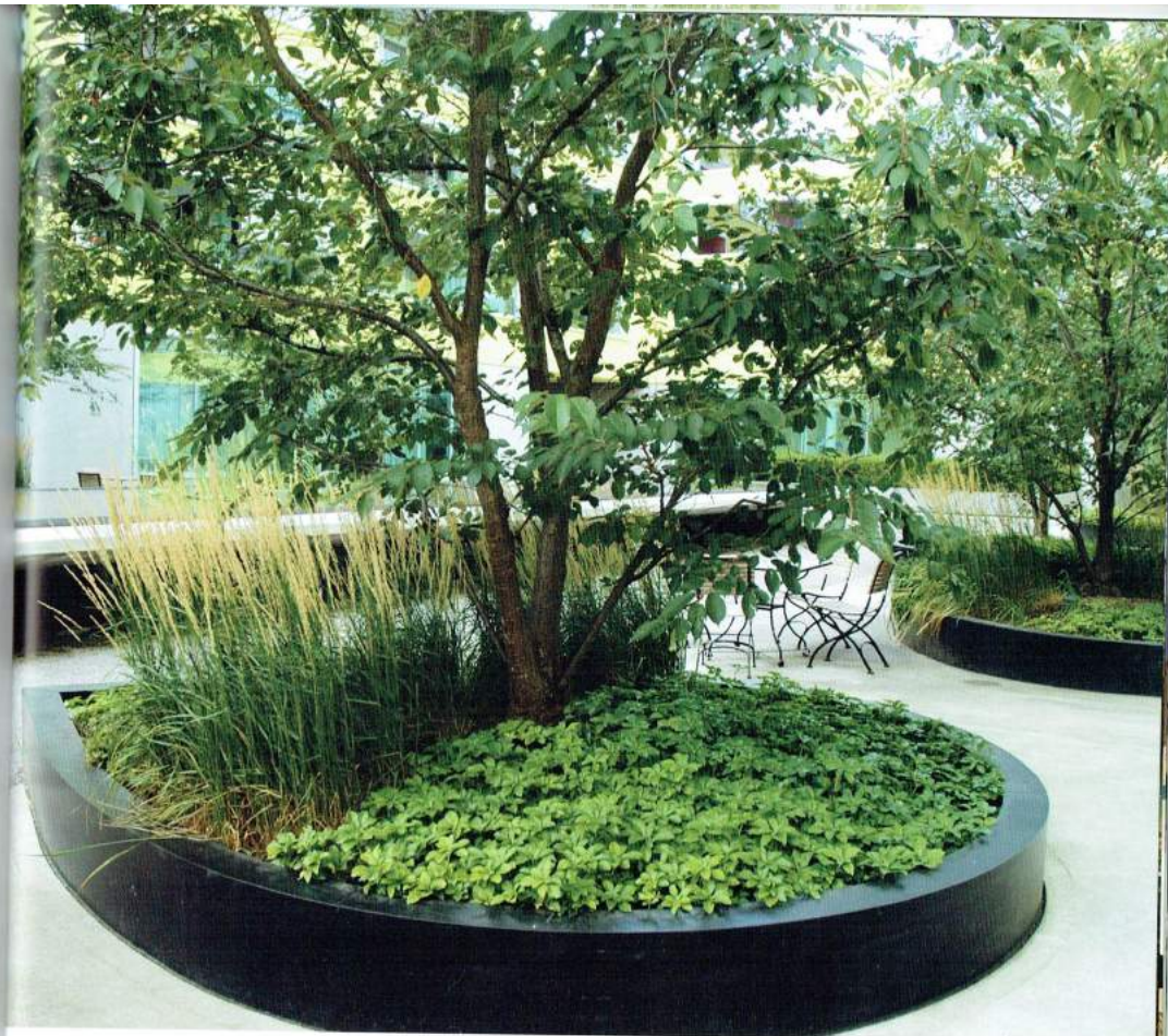
Meerstammige bomen in de Seniorenhof in Neu-Oetlikon (Zürich), een project van Atelier WW

"Eigenlijk hebben we hier twee kwekerijen binnen hetzelfde bedrijf," zo zegt hij. "De klassieke, gezaaide loofbomen zoals eik, beuk, linde, es en els vormen nog altijd onze hoofdteelt. Een deel daarvan is ook beschikbaar met autochtone herkomst, zoals Fraxinus excelsior 't hoge bos leper', Carpinus betulus 'Hayesbos', Alnus glutinosa 'ter hulst' en Quercus robur 'Warandeduinen'. Daarnaast hebben we een ruime keuze aan minder klassieke geënte variëteiten en fruitbomen, ook in grote maten, aan kleinere, landschappelijk waardevolle bomen en brede, hoge solitaire